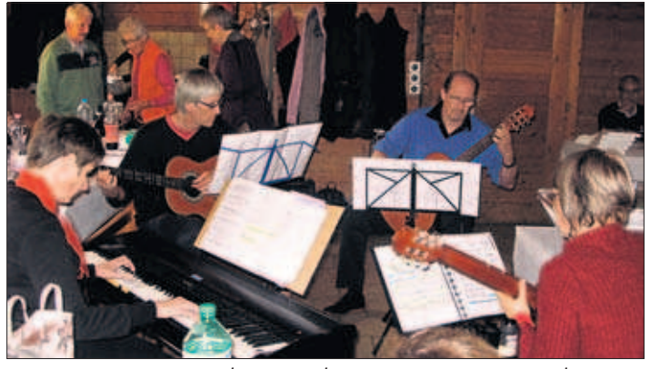
Un des intermèdes musicaux qui ont ponctué la journée