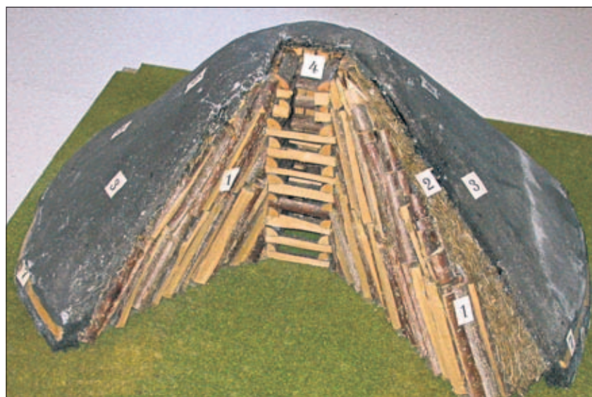
Maquette en coupe d'une charbonnière