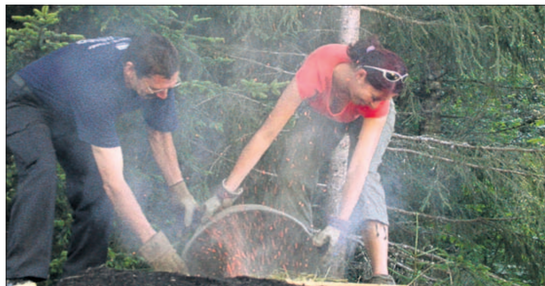
L'allumage de la charbonnière se fait en versant de la braise dans la cheminée

mètre pour une hauteur de 2,50 m comprenant, en son centre, une cheminée. Une fois le bois bien rangé, avec le moins de trous et d'espaces possibles, une couche de foin, correspondant à environ une demi-balle ronde, sera dis-